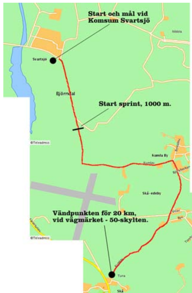
Banan är 5 km lång från start till vändning.